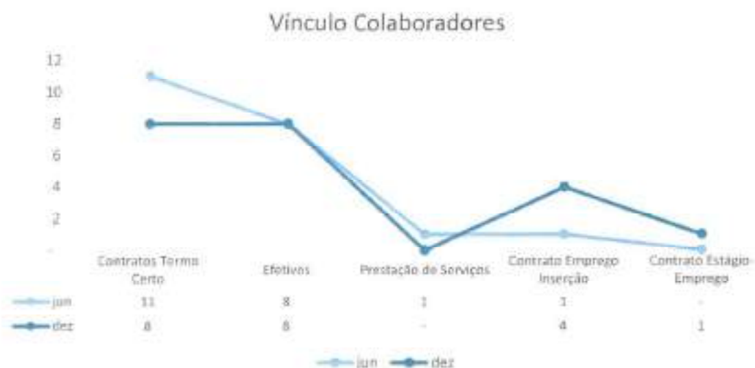
Gráfico 3 – Caracterização dos colaboradores por vínculo de trabalho

No gráfico acima são apresentados os números de colaboradores efetivamente em funções, de acordo com o vínculo laboral nos meses de junho e dezembro do ano em análise.