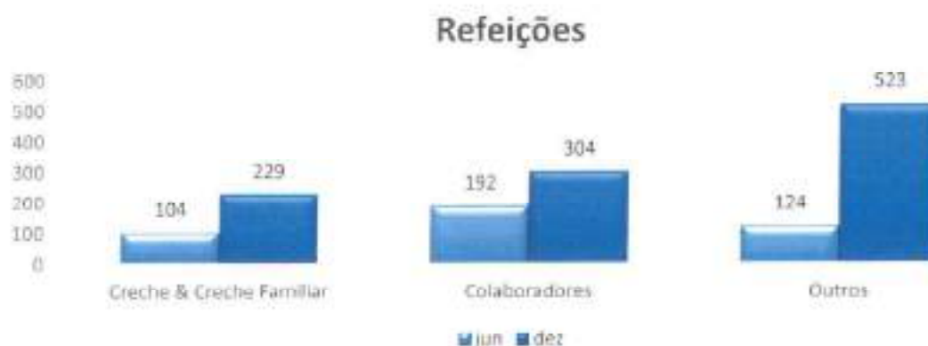
Gráfico 2 - Serviço de refeições fornecidas

Durante o período de confinamento, a TorreGuia encerrou os serviços de cozinha, retomando as atividades em 8 de junho, mantendo a modalidade de confeção própria com o apoio da empresa BLOS, que forneceu todo o apoio logístico da cozinha ao nível das ementas, HACCP, gestão de fornecedores, controlo de preços e custo/refeição para uma análise de gestão.