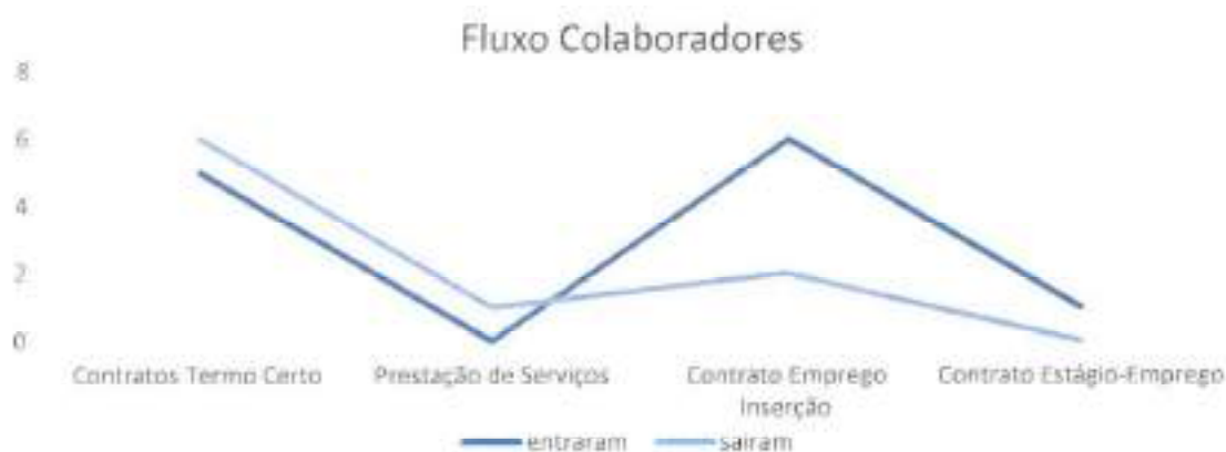
Gráfico 4 – Fluxo de entrada e saída de colaboradores por tipo de vínculo laboral

É de salientar que dos 9 colaboradores que finalizaram vínculos com a cooperativa foram: 2 contratos a termo certo finalizados por iniciativa da TorreGuia, 2 por iniciativa dos trabalhadores e 2 por encerramento dos serviços, 2 contratos emprego inserção 1 por motivos de saúde optou pelo término do contrato e 1 finalizado, mas convertido em contrato de trabalho; 1 prestador de serviço que por não ter condições de saúde para continuar a atividade se optou pelo término do contrato.