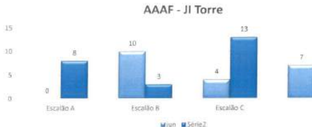
Gráfico 1 – Distribuição dos clientes de AAAF por escalão

O gráfico acima mostra o número de crianças que integraram o serviço de AAAF dinamizado pela TorreGua no jardim-de-infância da Torre do Agrupamento de Escolas de Caciais, bem como a sua distribuição pelos escalões de participação, que apresentam redução nos escalões A e B e paradoxalmente um aumento no escalão C.